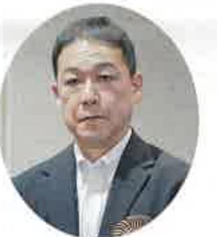
経済産業省 辻本保安審議官