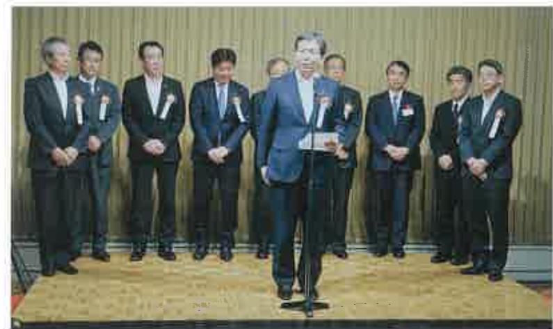
関係団体・メーカーのご来賓