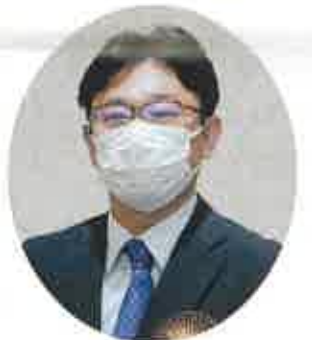
経済産業省 前田電力安全課長