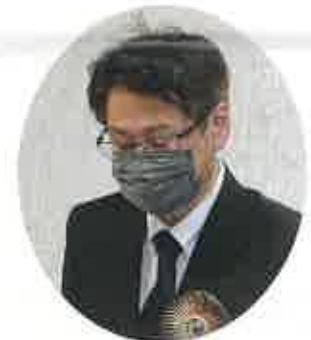
経済産業省 榎福電気保安室長