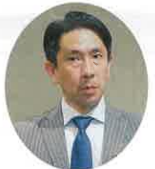
宮本周司参議院議員代理 不破政策秘書