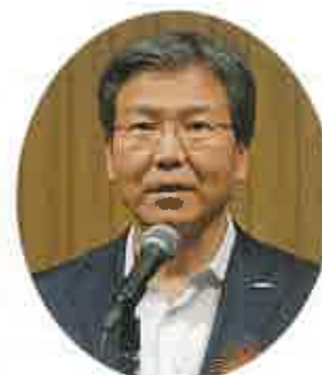
パナソニック株式会社 エレクトリックワークス社 大瀧社長