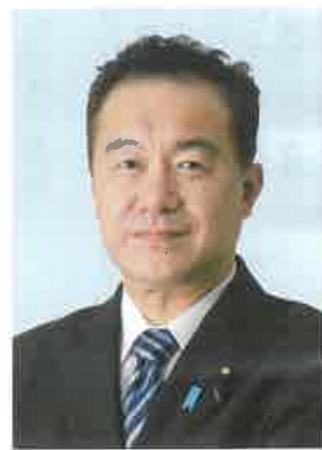
総務大臣政務官 衆議院議員

電が可能になりました。 時代の先を見据えて新 たな仕組みを作ること で、新時代の扉を開くこ とが可能になる。今年 はそんな年になるのでは ないでしょうか。 欧州や中東での戦乱を はじめとする国際情勢 や、国内の状況に鑑みま す。本年は時代の大き な転換点であると思われ ます。我が国は政府・与 党一体となって施策を実 行し、確実に新時代への 基礎固めをしてまいりま した。 一方で、国民生活に直 結するエネルギー問題は