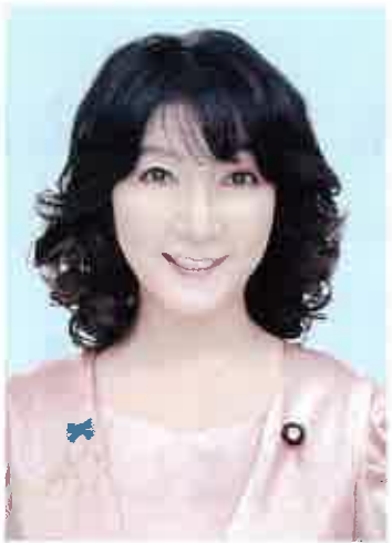
電気工事議員連盟幹事長 参議院議員(全国比例区) 片山 さつき

去る11月29日(水)総合経済対策にもとづく補正予算が国会で決定されました。一般会計追加額約13兆円です。令和4年度補正より約2,000億円増額になっています。特に国土強靱化は、5ヶ年15兆円のうちインフラ分9兆円の加速化対策の残費が、私の計算では約1.8兆円しかない。このままでは、計画し、実行する、という国会議員等に、