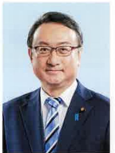
前内閣府特命担当大臣 参議院自由民主党幹事長代行 参議院議員 岡田 直樹