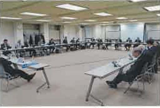
理事会で各委員会の所管事項を審議

人材確保育成、成育センター、グループの審議テーマと検討状況、外国人労働者の雇用について先行事例の実態調査を進めていく方針だ。