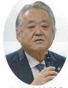
あいさつする米沢会長