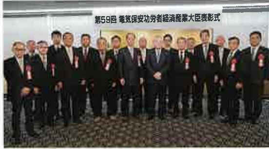
全日電工連関係者で記念撮影